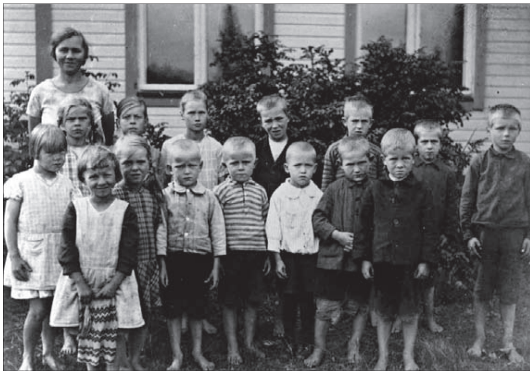
Fotografiet av de svenska barnen i Sorjos skola är taget i slutet av 1920-talet

Sorjos fick småningom också en egen järnvägsstation, vilket ledde till finsk inflyttning. Järn-