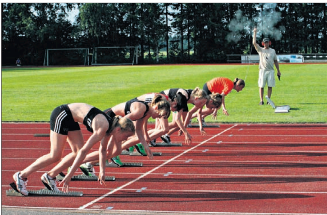
Den 7 juli avgjordes distriktsmästerskapet i friidrott på sportplan i Vörå. Barn och ungdomar från när och fjärran var med.