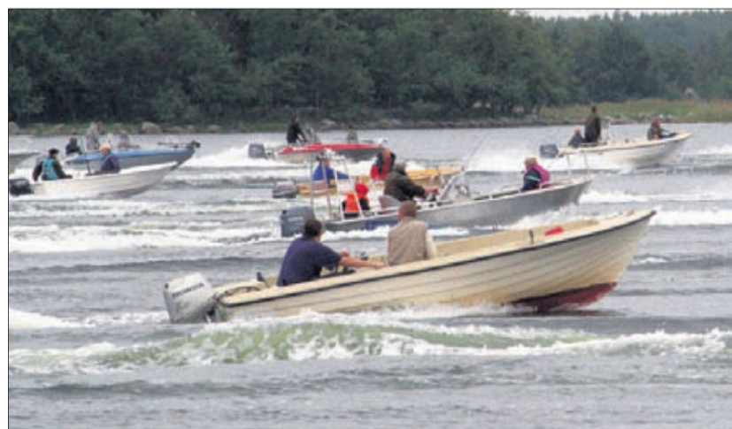
Den 3 september ordnades Gäddkastet i Oravais. 315 kilogram gädda drogs upp.