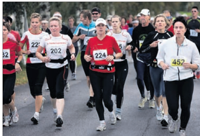
Botnialöpet passar både unga och äldre. Nytt för i år är ungdomsklassen för dem som ännu inte fyllt 17 år.

Det finns vätskekontroller med cirka tre kilometers mellanrum. Vid alla kontroller serveras sportdryck och vatten. Dessutom