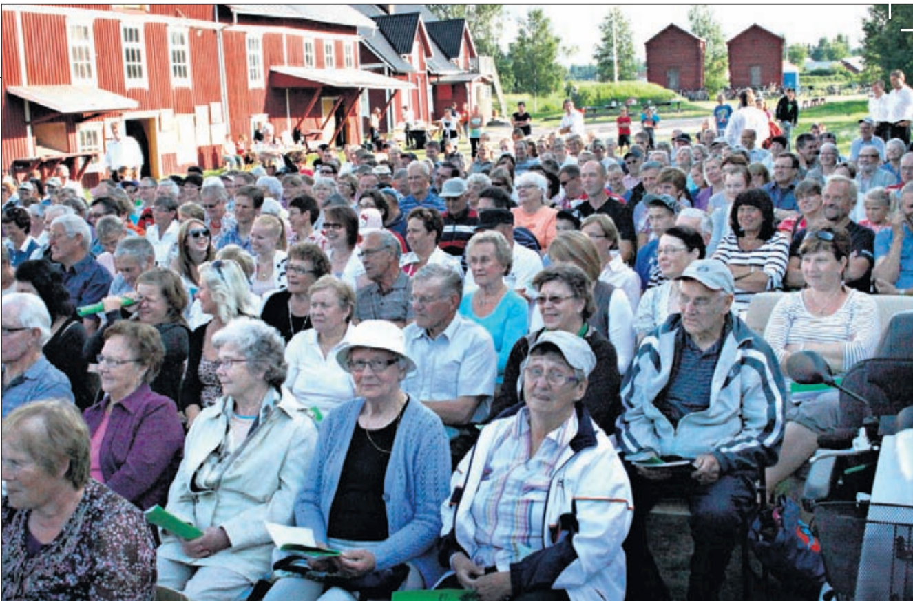
Den 6 juli var det dags för den traditionella allsungen vid Rökiö kvarn. Buslaster med ivriga allsångare hade kommit från hela Österbotten och arrangörerna tvingades söka efter fler stolar för att alla skulle få någonstans att sitta.