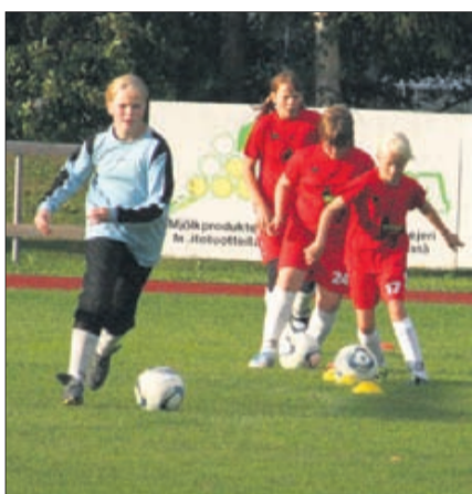
I träningen ingår olika slags dribblingsövningar.