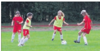
Samspelet mellan lagmedlemmarna är viktigt.