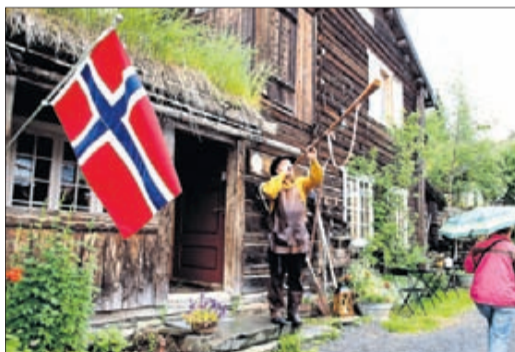
Värden hälsar gästerna välkomna till sin gård och Frydenlunds teater.

Föreställningen omfattade valda delar ur teaterstycken och musik från Danmark, Finland, Norge och Sverige, av exempelvis Henrik Ibsen, Tove Jansson, Alf Pröysen, Evert Taube, Benny Andersson med flera. Inslagen framfördes med dramatik, humor och värme och uppskattade mycket av publiken.