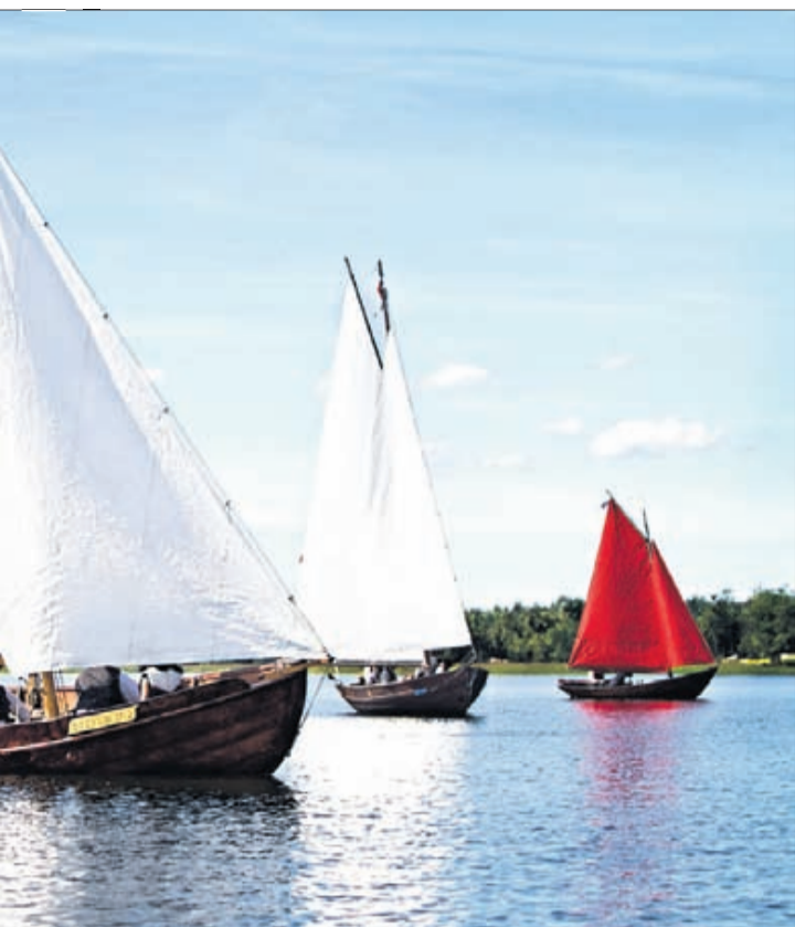
... Här är det Vita Frun som söker efter vind i konkur- Årets vinnare blev dock Grisselö som tagit med marens bästa jobb", ansåg de.