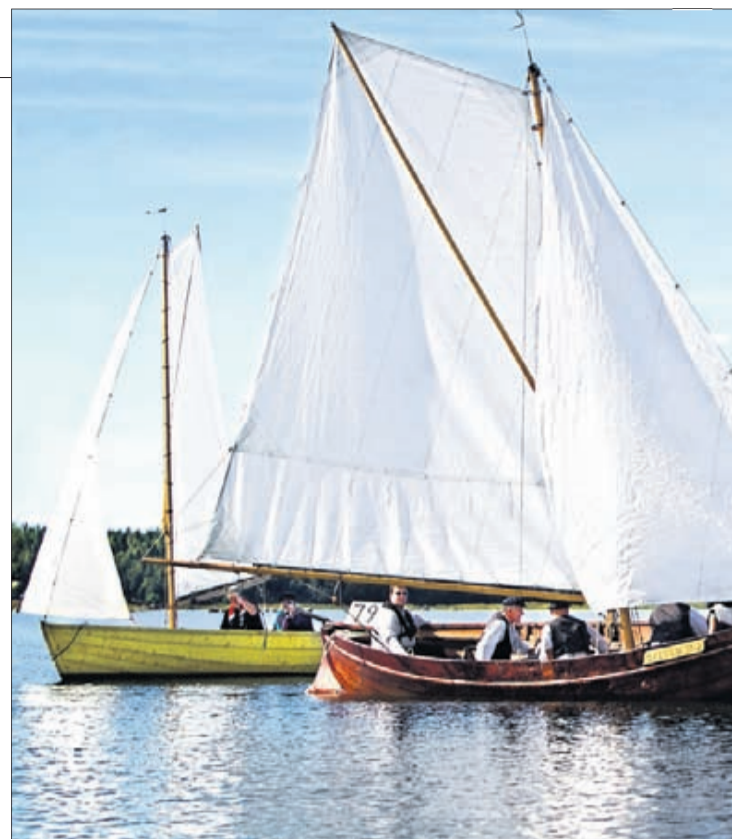
Den 13 augusti ordnades Oravaisregatta. Här är deltagarna med Steinblind, Årvass och Skarven. Årets vinnare är Vasabladets reporterteam till sjöss. "Sommarens bästa"